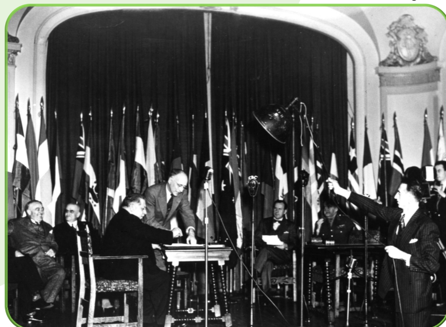
Assinatura de Constituição da FAO, 16 Out. 1945, Canadá.